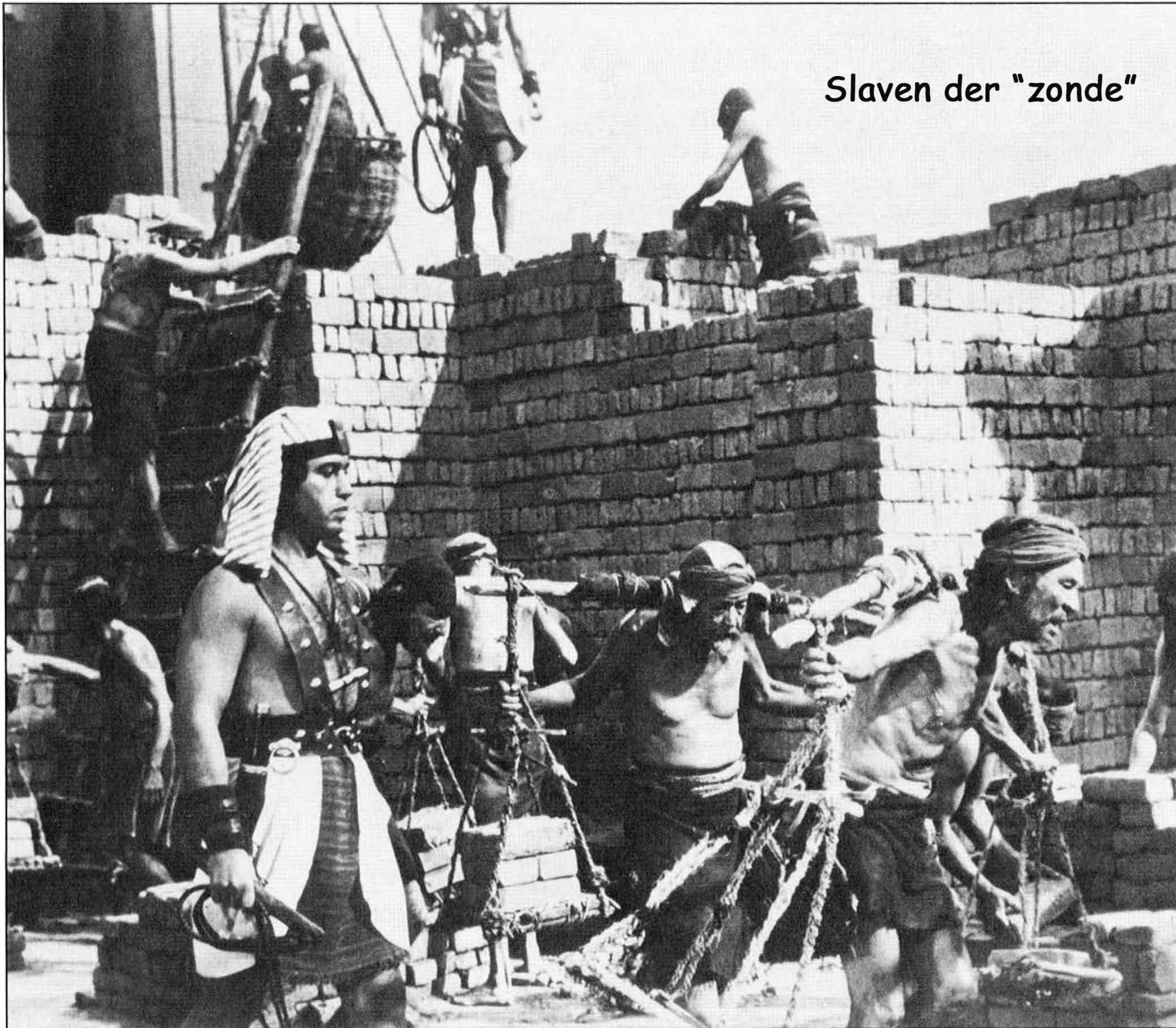
Slaven der "zonde"